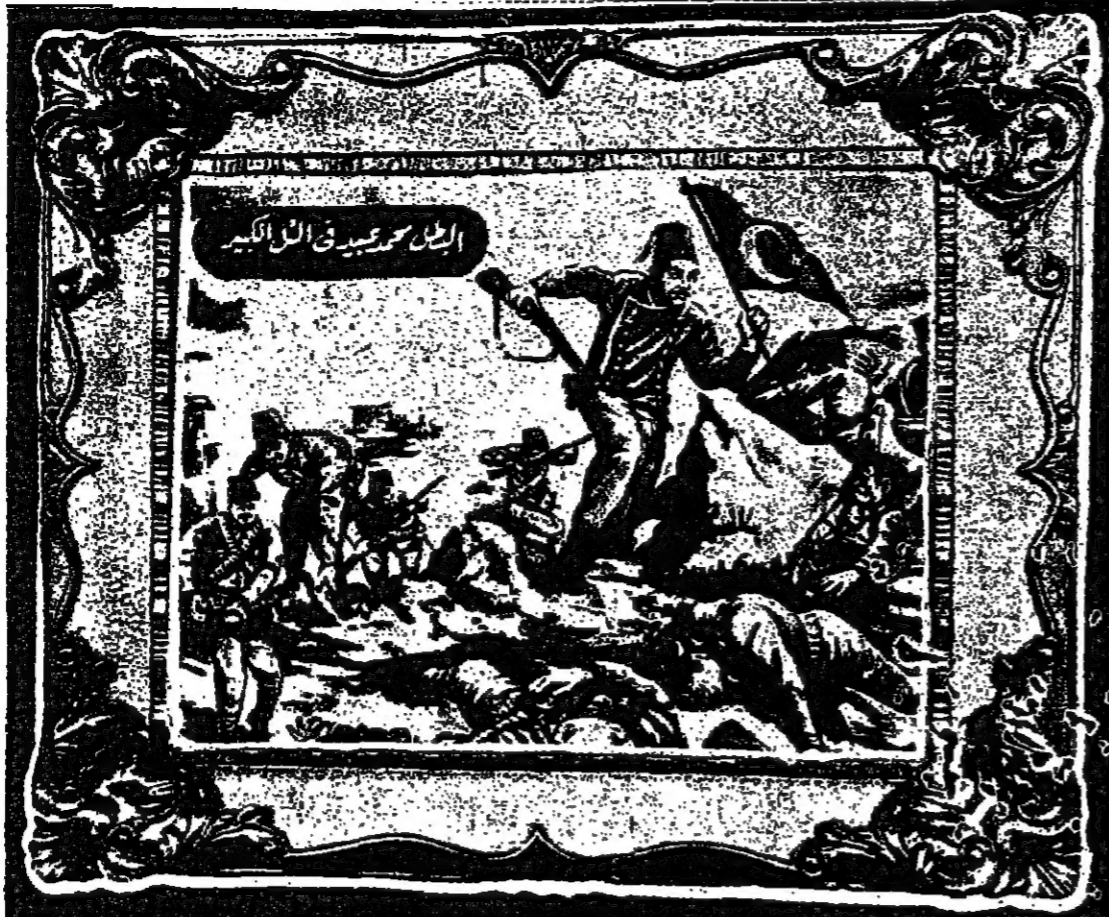
البطل محمد عبيد في « التل الكبير »

ردح ملكي بالتلفون كان الملك جورج الخامس يجابت شقيقته الاميرة فكتوريا كل صباح في موعد محدد بضع دقائق ، يبدلان خلالها الراي في مسائل شتى .. وحدث ذات صباح ان فق التلفون في حجرة نوم الاميرة قبل الموعد المسموع بقليل ، فترمت الساعة وقالت قبل ان تعرف من يناديها : — هالو .. اينما الحق المعجز .. وعندت تدخلت عملة التلفون بقولها : — ارجو المعذرة يا صاحبة السوء ، فان جلانته لم يبدأ حديثه بعد .. !!